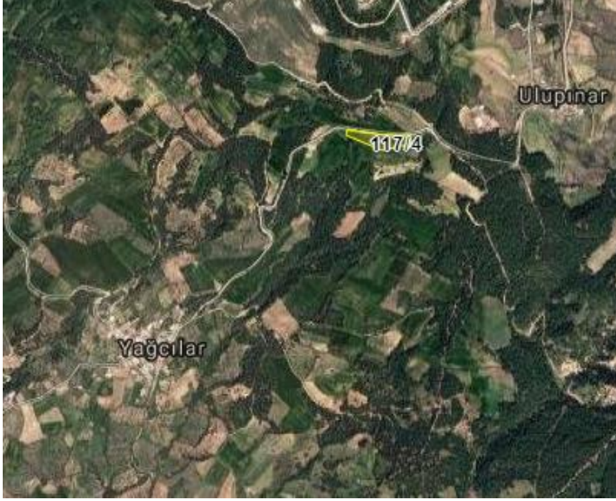
Resim 1.Parselin uydu görüntüsü

Planlama alanı; Çanakkale ili, Merkez ilçesi, Yağcılar Köyü, Öğren Mevkii, H16C20A2A paftası, 117 ada 4 parsel üzerinde yer almaktadır. Planlama alanının yüzölçümü 17.700,27 m2dir.