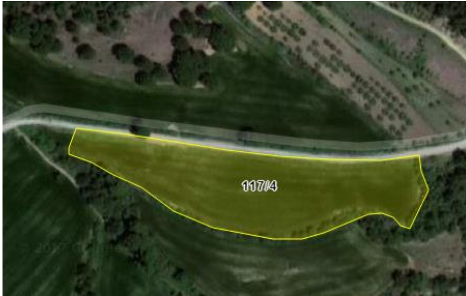
Resim 2.Parselin yakın uydu görüntüsü