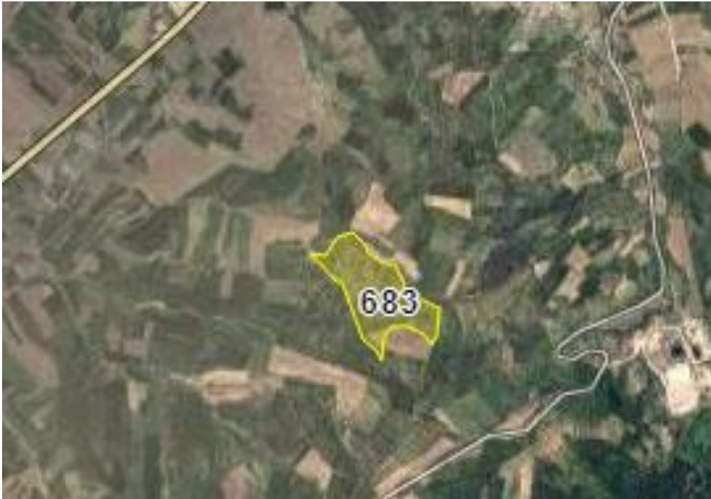
Resim 2.Parselin uydu görüntüsü