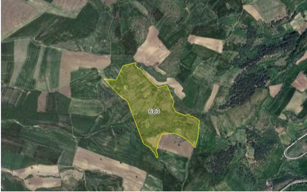
Resim 1.Parselin uydu görüntüsü

Planlama alanı; Çanakkale ili, Merkez ilçesi, Musaköy Köyü, 683 parsel üzerinde yer almaktadır. Planlama alanının yüzölçümü 202,900 m2dir.