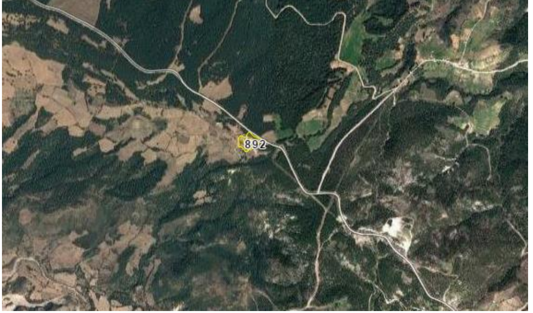
Şekil 1.1. Çalışma Alanının Konumu

Çalışma alanı, Çanakkale İli, Merkez İlçesi, Kemel Köyü, Bağmat Mevkii'nde H17D12A1D ve H17D12A1C paftalarında ve 892 nolu parselde yer almakta olup Çanakkale il merkezine 20 km. mesafede yer almaktadır. Dört mevsim ulaşım mümkündür.