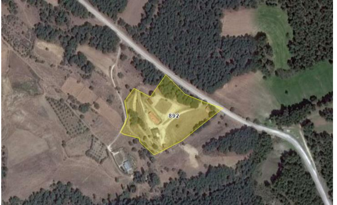
Şekil 1.2. Çalışma Alanının Konumu