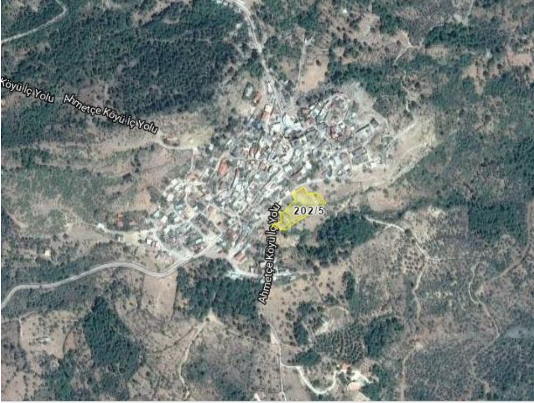
Resim 1.Parselin uydu görüntüsü

Planlama alanı Ayvacık ilçe merkezine yaklaşık 15 km uzaklıkta bulunmaktadır. Ayvacık ilçesi, Ahmetçe Köyü, Pafta I16C-25B-2B, Ada 202, Parsel 5’de yer almaktadır. Planlama alanının yüzölçümü 3.943,81 m2dir.