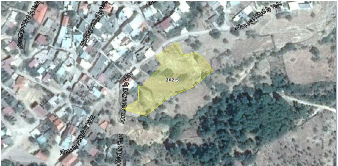
Resim 2.Parselin yakın uydu görüntüsü