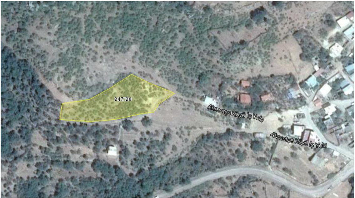
Resim 2.Parselin yakın uydu görüntüsü