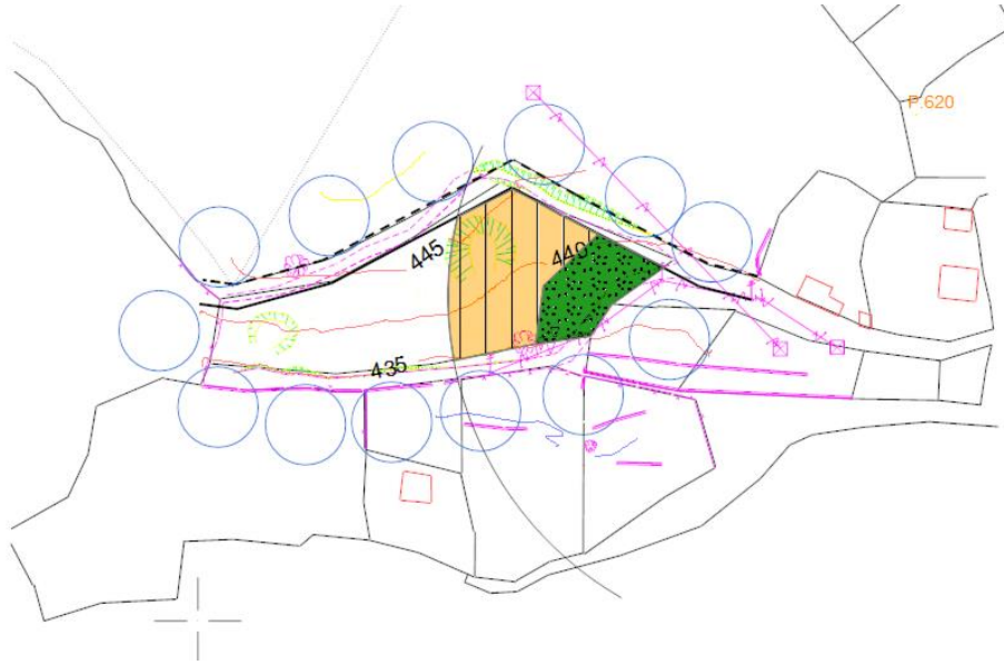
Resim.3. 1/5000 Ölçekli Öneri Nazım İmar Plan

1/100.000 ölçekli Balıkesir-Çanakkale Planlama Bölgesi Çevre Düzeni Planı 8.2. Kırsal Yerleşik Alanlar hükümleri yapılaşma şartları göz önünde bulundurularak, hazırlanan planda düşük yoğunluklu konut alanı ve yeşil alan olarak düzenleme yapılmıştır. Yapılaşma detayları 1/1000 ölçekli Uygulama İmar Planı pafta ve raporunda belirtilecektir.