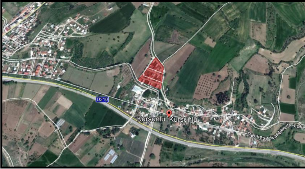
Google Earth görüntüsü; 16.10.2017

Söz konusu alan Çanakkale ili, Merkez İlçesi, Kurşunlu Köyü 188 parselde yer almaktadır. Taşınmazın tapu yüzölçümü 12.600 m2dir. Planlama alanı köy yerleşik alanına yakın mesafede olup, üzerinde çok sayıda köy evi bulunmaktadır. Alanın uydu görüntüleri aşağıda yer almaktadır.