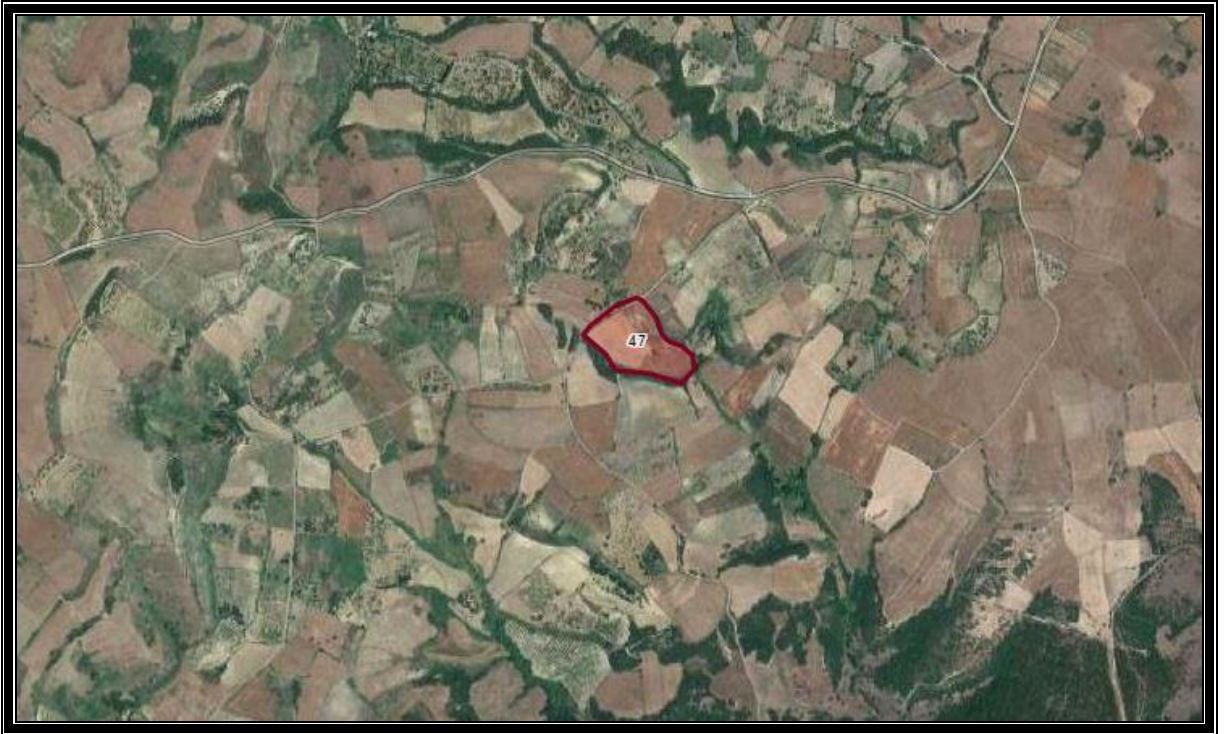
ŞEKİL 5. Planlama Alanının Uydu Görüntüsü Üzerindeki Konumu.