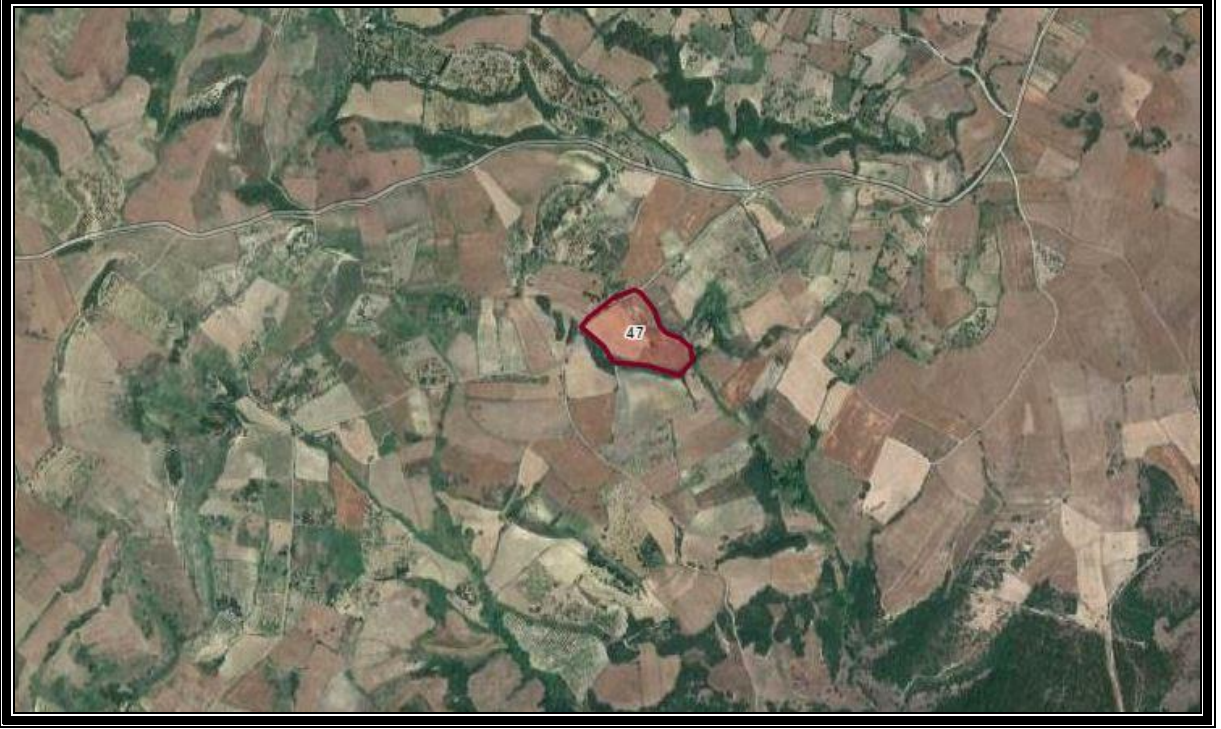
ŞEKİL 1. Planlama Alanı ve Yakın Çevresi [Uydu Görüntüsü-Uzak].

İlçenin yüzölçümü 955 km 2 'dir. Genel olarak dağlık ve engebeliklerle kaplıdır. Bu engebelik kısımlar ormanlarla kaplı ise de kereste değeri olmayan baltalık şeklinde örtülmüştür. Dağlar Çanakkale Boğazına paralel olarak uzanırlar. Bu nedenle kıyı kesimlerinde Çardak, Umurbey ve delta ovaları yer alır. İç kesimler ise fazla yükseltisi olmayan yer yer akarsu vadileriyle yarılmış engebeli alanlarla kaplıdır. İlçede devamlı akan önemli akarsu yoktur. Akarsular dere ve çay şeklindedir. Bunlar yağışlı mevsimlerde akar ve yaz aylarında genel olarak kururlar. Lapseki İlçesinin rakımı 3 m'dir. İlçe sınırları içinde 2 adet baraj ve 3 adet gölet mevcuttur.