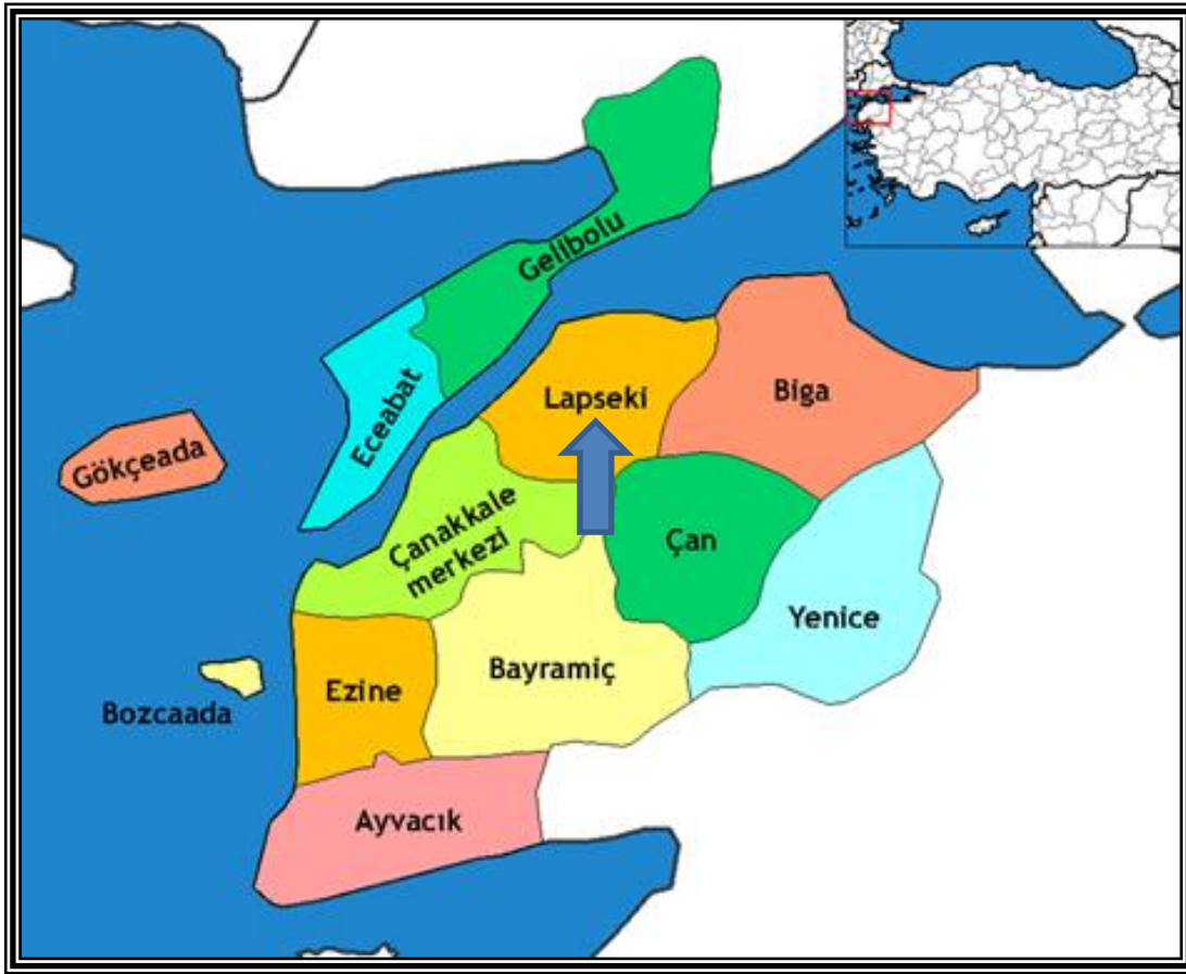
ŞEKİL 3. Planlama Alanının Çanakkale İli İlçe Sınırları İçindeki Yeri.