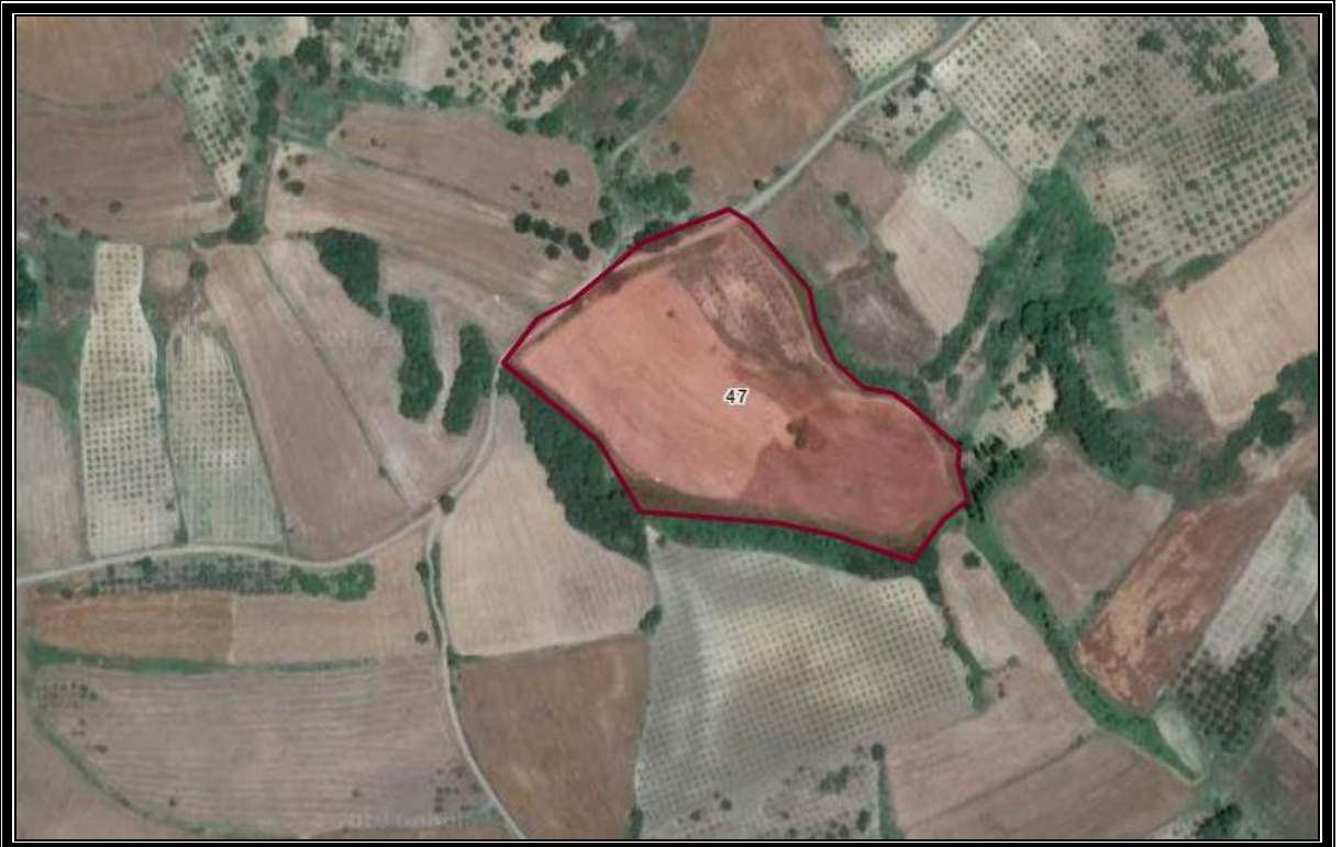
ŞEKİL 2. Planlama Alanı ve Yakın Çevresi [Uydu Görüntüsü-Yakın].