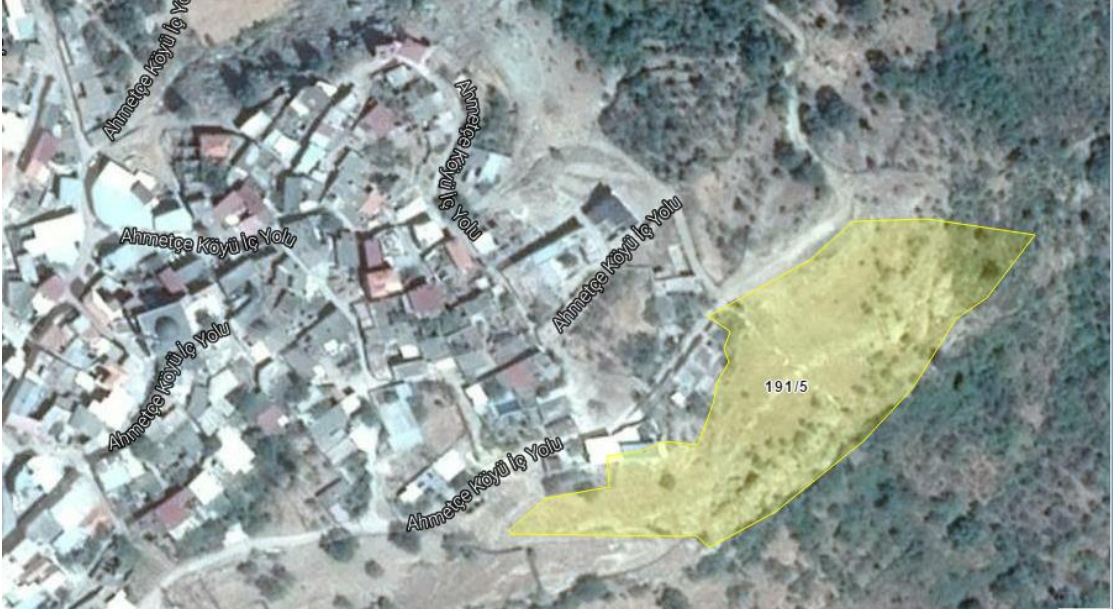
Resim 2.Parselin yakın uydu görüntüsü